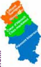
Plate-formes Emploi RSA

Ligne d'urgence 04 67 23 67 67 Centre d'Informations Clientales 04 67 47 47 47 Métropole 04 67 42 62 67 Pôle emploi 04 67 47 47 47